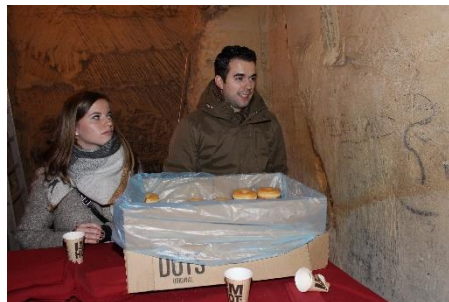
Ons "Donuts and hot chocolate" team.