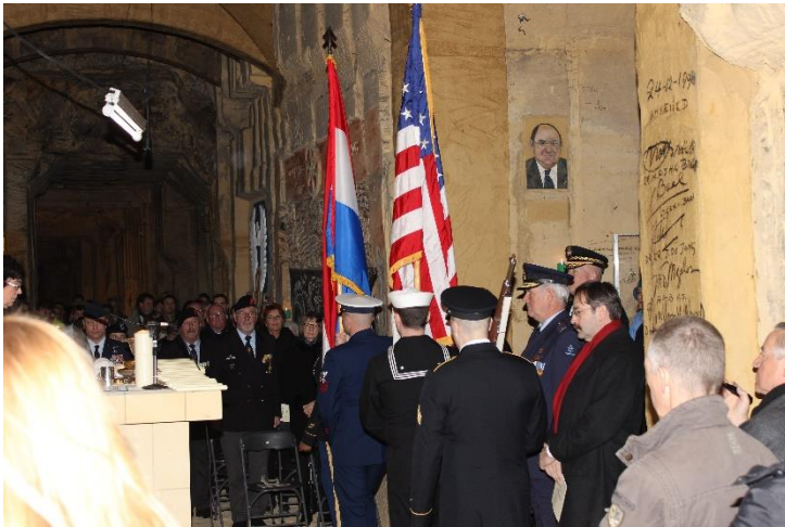
Opening van de herdenking door de colorguard.