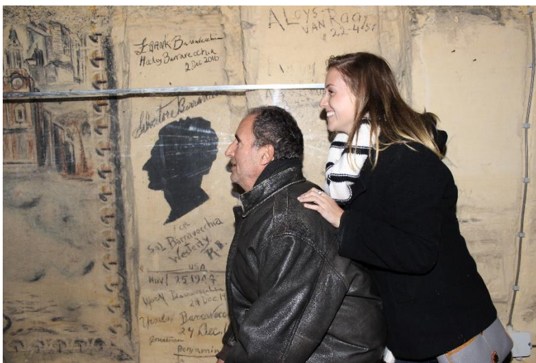
Zo vader zo zoon !