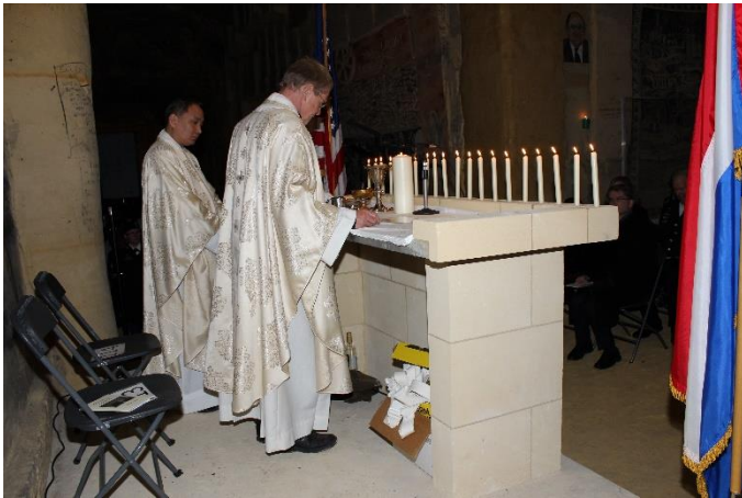
De Heilige Mis.