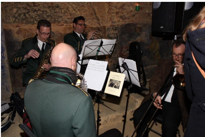
De muzikale omlijsting