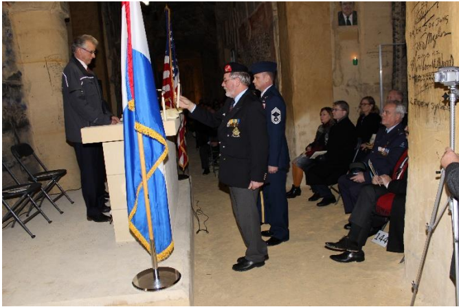
Herdenking van de gevallen door het aansteken van kaarsen op het altaar.