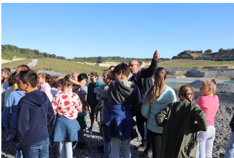
Deskundige uitleg in de groeve

I. v. m. het grote aantal activiteiten dat tegelijk plaats vond, is in overleg met en na toestemming van de provincie, de gemeente Eijsden-Margraten, Natuurmonumenten en de verschillende scholen besloten het project over te hevelen naar de maanden april en mei 2020. Hiermee kan worden voorkomen dat de leerlingen te veel informatie tegelijkertijd moeten verwerken.